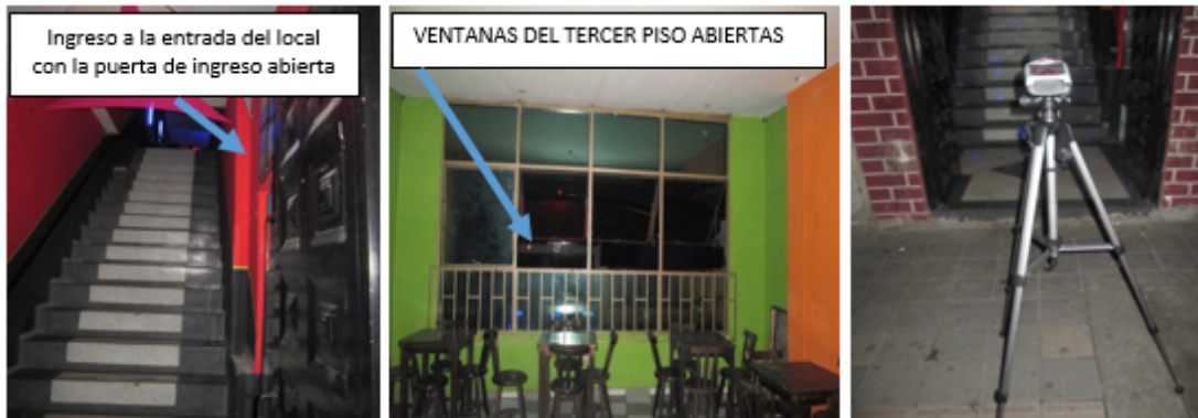
Fotografía No 4 entrada principal con la puerta de ingreso abierta, Fotografía No 5 vista del tercer piso con las ventanas abiertas. Fotografía No 6 Medición de los niveles de presión sonora emitidos